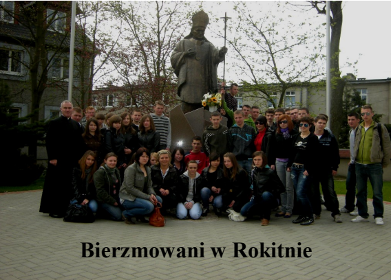
Bierzmowani w Rokitnie