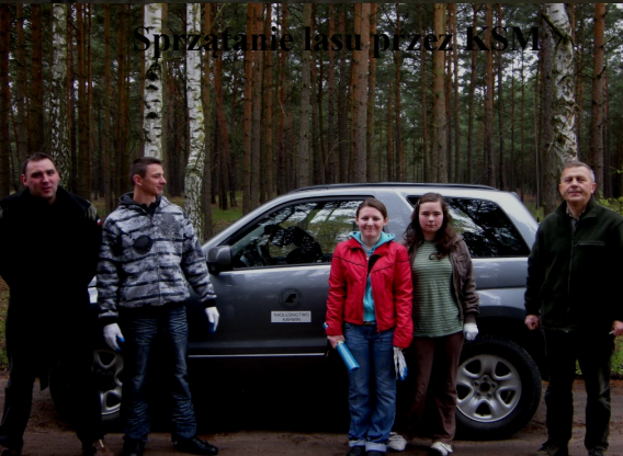
Sprzątanie lasu przez KSM