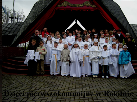
Dzieci pierwszokomunijne w Rokitnie