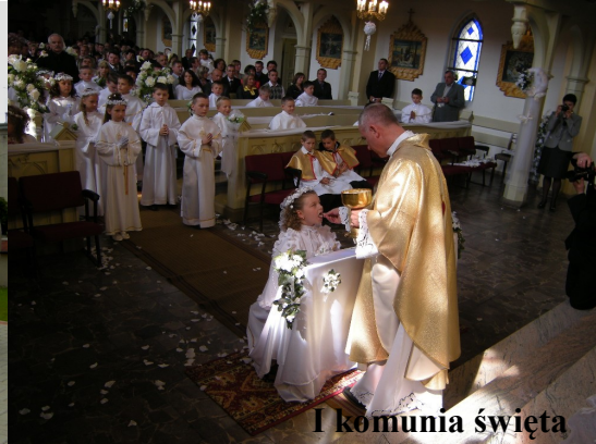
I komunia święta