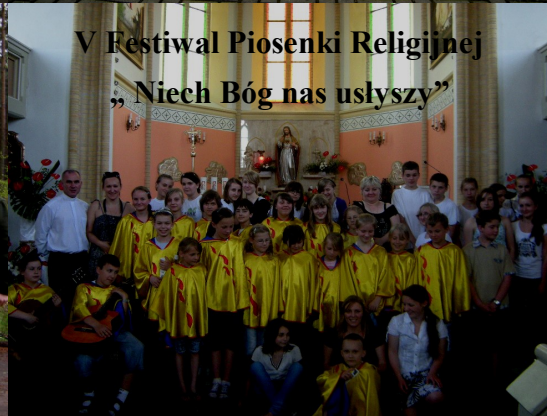
V Festiwal Piosenki Religijnej „Niech Bóg nas usłyszy”